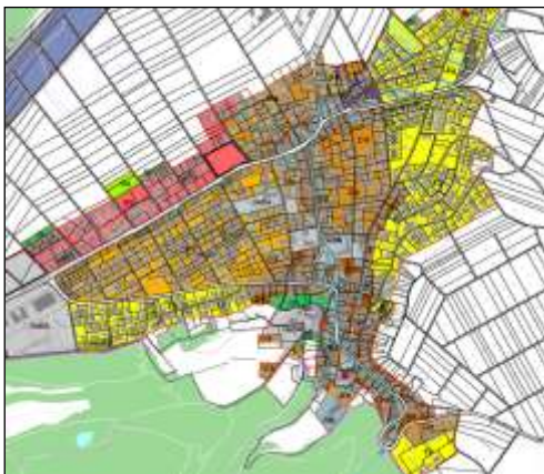
Gesamtrevision Nutzungsplanung, Würenlingen